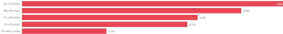
por Rango de Edad

META Para 2030, elaborar y poner en práctica políticas encaminadas a promover un turismo sostenible que cree puestos de trabajo y promueva la cultura y los productos locales.